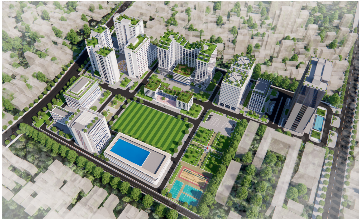
Quy hoạch khu A, học viện kỹ thuật quân sự, Bắc từ Liên, Hà Nội

Các chương trình đào tạo, phát triển nhân sự cũng được triển khai bài bản, giúp nâng cao trình độ chuyên môn và khả năng thích ứng với các xu hướng mới trong ngành. Đây là minh chứng cho sự quan tâm đặc biệt của Ban lãnh đạo đối với sự phát triển bền vững của công ty.