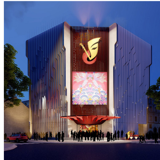
Nhà hát Cải Lương, Hai Bà Trưng - Hà Nội