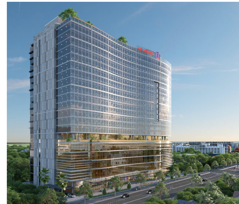
Văn phòng giao dịch và giới thiệu sản phẩm - Xuân Phương, Nam Từ Liêm, Hà Nội

Các dữ liệu địa hình mà UAC cung cấp là cơ sở vững chắc để lập phương án thiết kế, quy hoạch và triển khai thi công. Điều này giúp giảm thiểu rủi ro, tiết kiệm thời gian và chi phí cho các dự án.