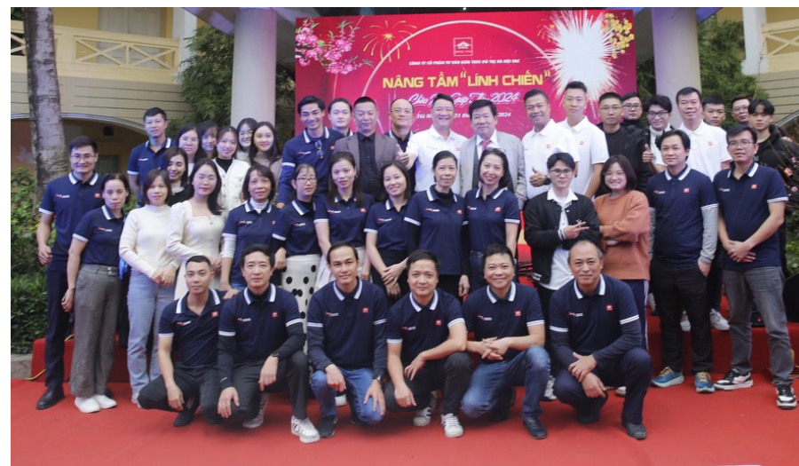
Các thành viên UAC

Năm 2024, UAC đã hoàn thành nhiều dự án từ khu đô thị hiện đại, công trình công cộng, đến các dự án nhà ở, văn phòng và khu nghỉ dưỡng cao cấp. Mỗi công trình đều được tối ưu hóa để tạo ra không gian sống xanh, tiện nghi, góp phần cải thiện chất lượng cuộc sống cho cộng đồng. Đặc biệt, công ty không ngừng áp dụng các giải pháp kiến trúc bền vững như: Sử dụng vật liệu thân thiện với môi trường, thiết kế tiết kiệm năng lượng và tích hợp các giải pháp thông minh.