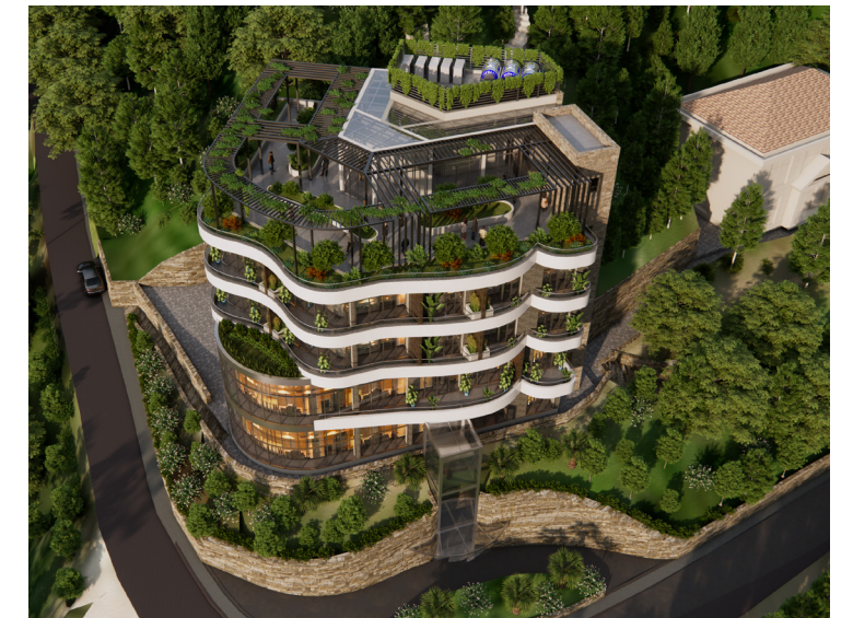
Nhà nghỉ Tam Đào, Vĩnh Phúc