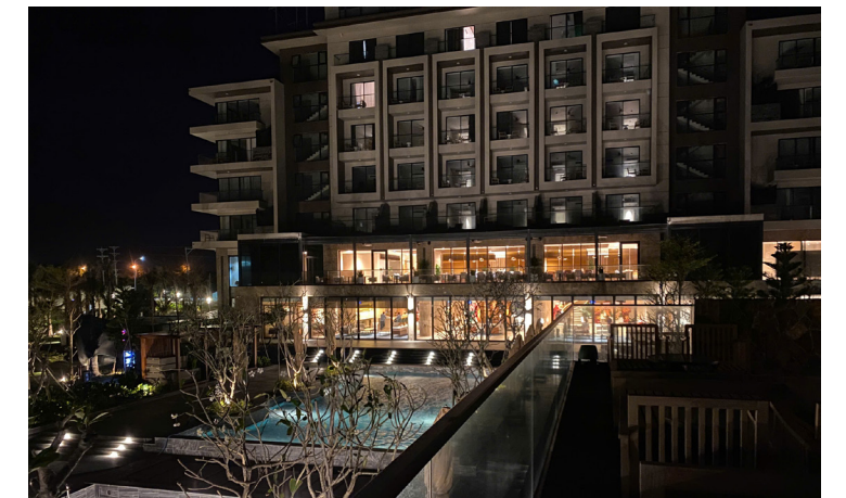
Khu du lịch Trường Hải, Mũi Né - Phan Thiết