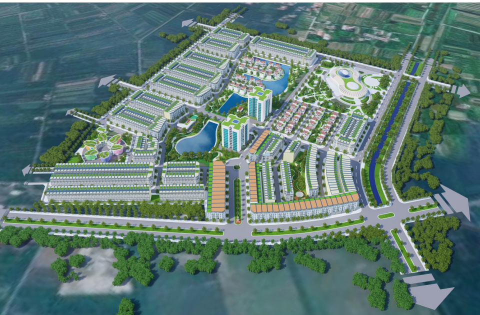
Khu đô thị Tân An, Khoái Châu - Hưng Yên